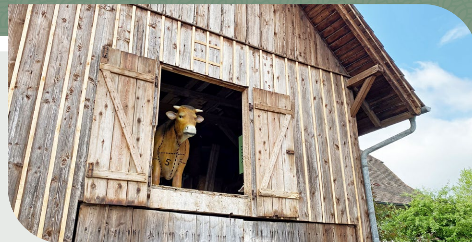
Wartet im Winterlager auf seinen Einsatz: Buurelandweg-Muni.