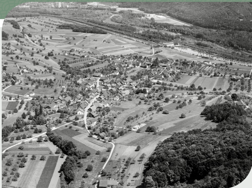
Historisches Luftbild von Mai 1964